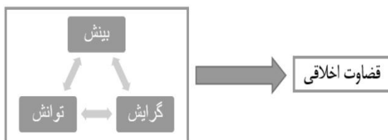
شکل ۲: رابطه قضاوت اخلاقی و سه بعد بینش، گرایش و توانش

با توجه به اینکه هر فعل اختیاری به سبب وجود عنصر «اختیار» نیازمند سه عنصر «بینش»، «گرایش» و «توانش» است و نیز «قضاوت اخلاقی» یکی از مصادیق فعل اختیاری است، می‌توان نتیجه گرفت: قضاوت اخلاقی وابسته به ابعاد بینشی، گرایشی و توانشی است.